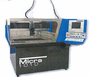
CNC 3 axes pour la découpe à jet d'eau